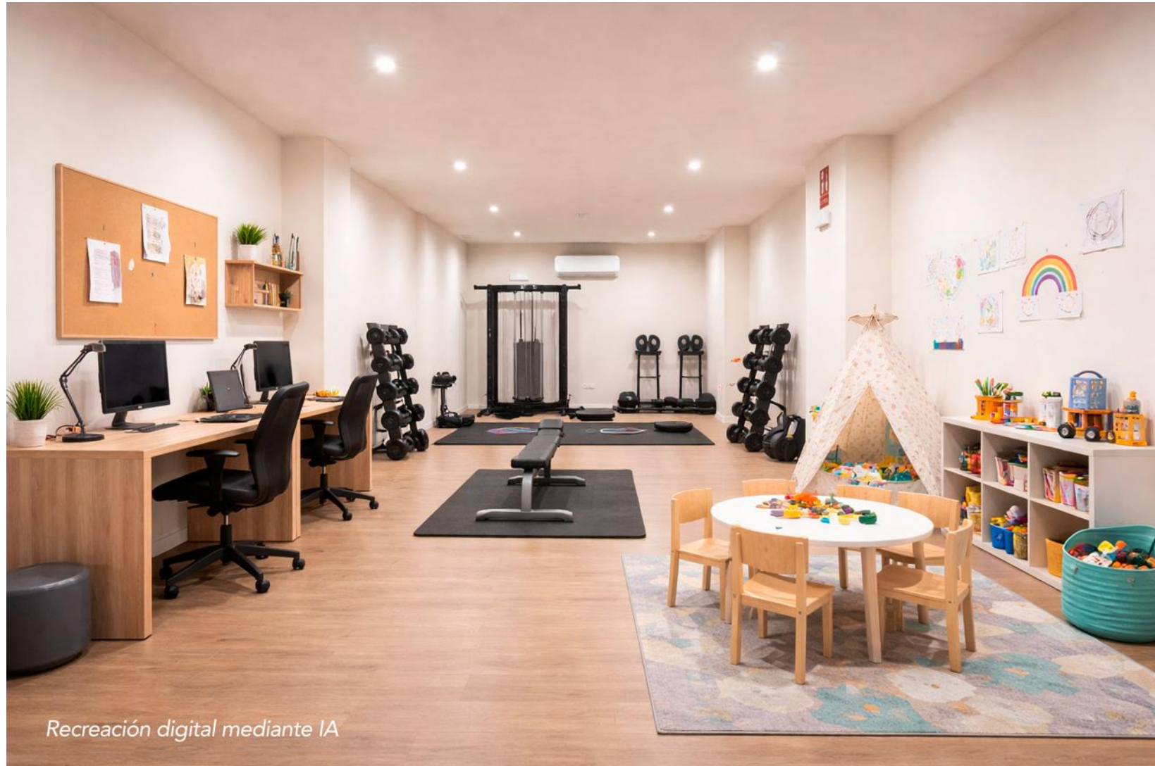
Recreación digital mediante IA