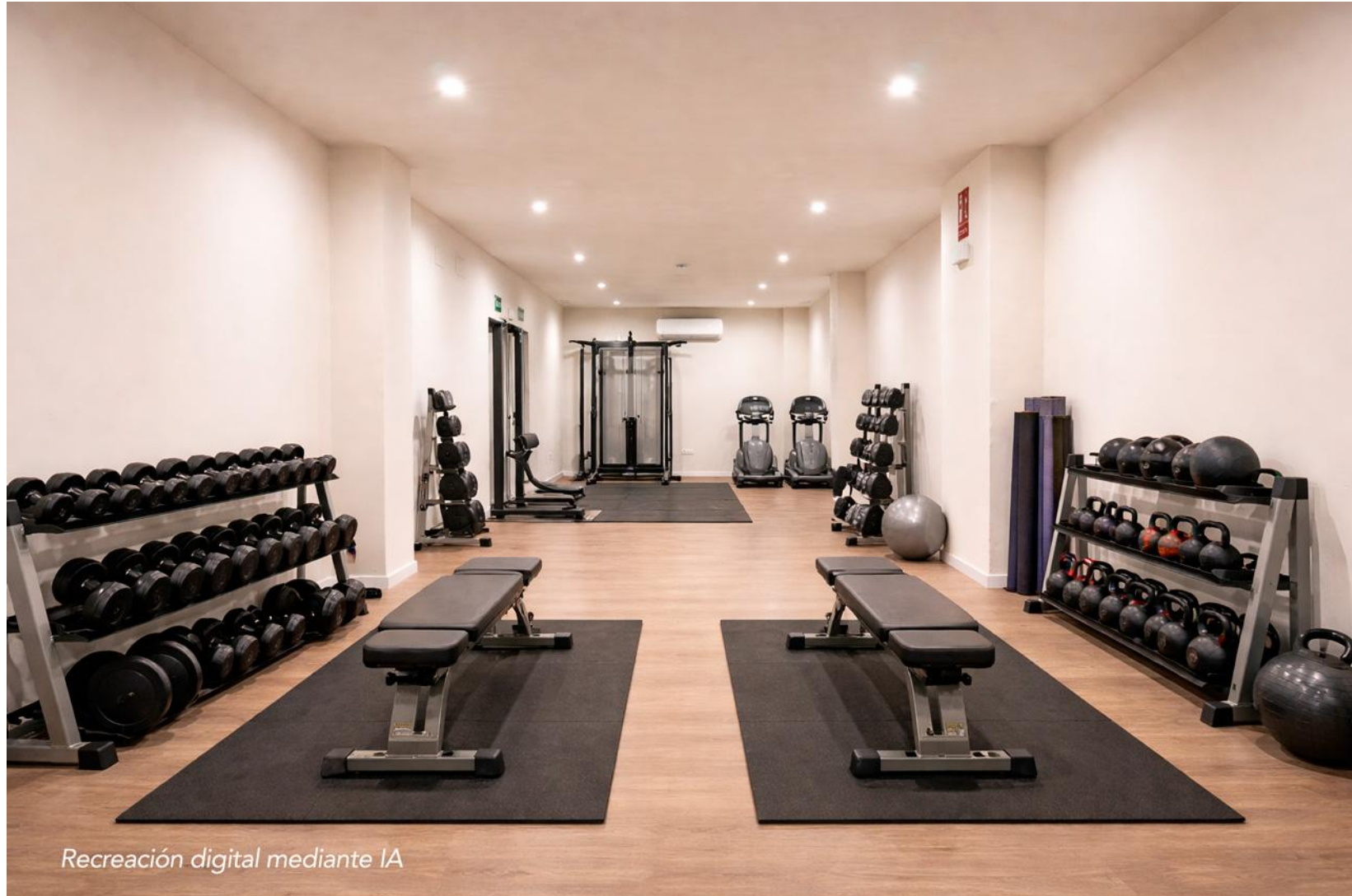
Recreación digital mediante IA