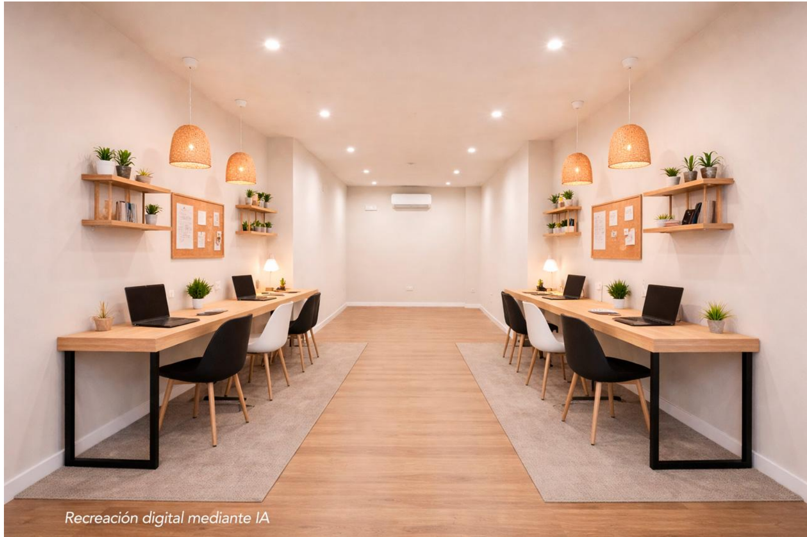
Recreación digital mediante IA